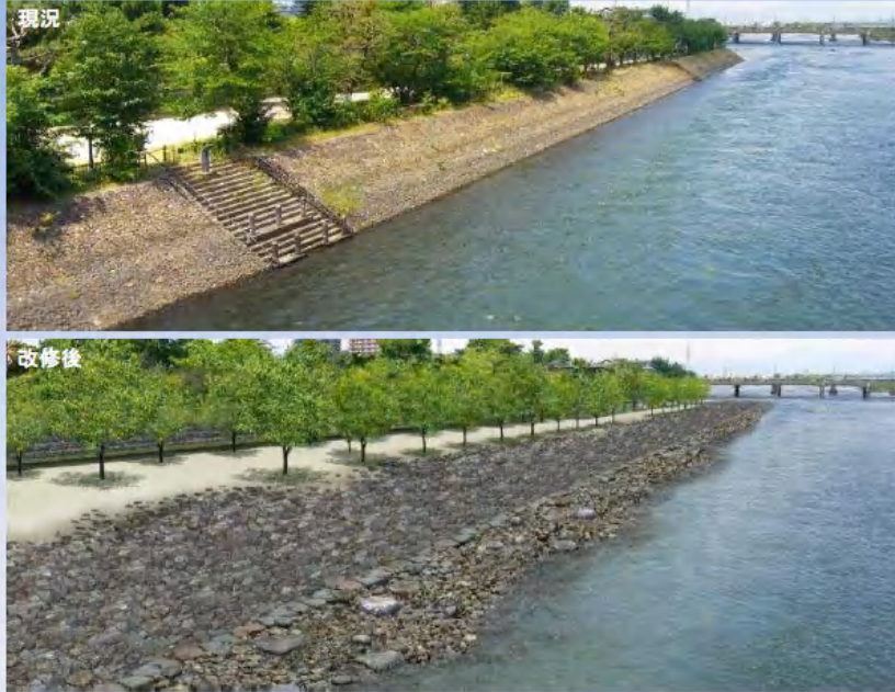
宇治川左岸護岸(朝霧橋より下流を望む)